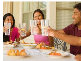
EN EL HOGAR Disfrute agua pura Ozonizada al presionar un botón