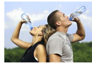
EN TODO LUGAR Desinfecte recipientes, y acompañese de agua pura siempre.