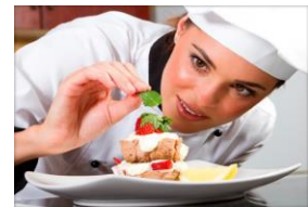
RESTAURANTES Y HOTELES En la preparación de alimentos