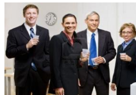
Proporcione agua pura al personal de su Empresa